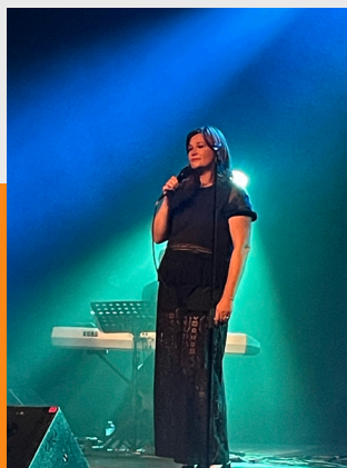
Cabaret chanson Rue de Montréal