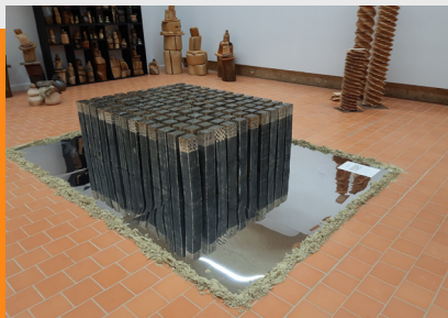
Exposition Chantal Bidel