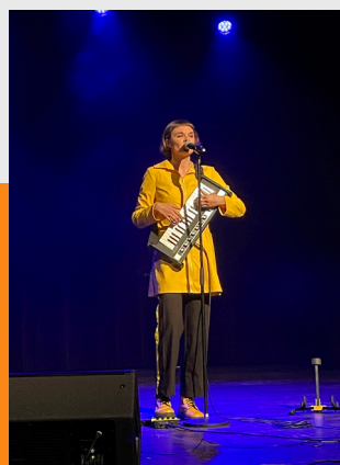
Cabaret chanson Adély's