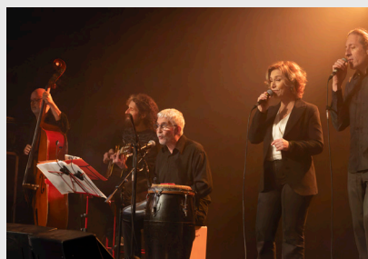
Cabaret chanson Zazou'ira