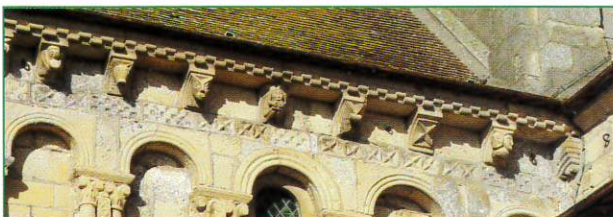
Détail des modillons