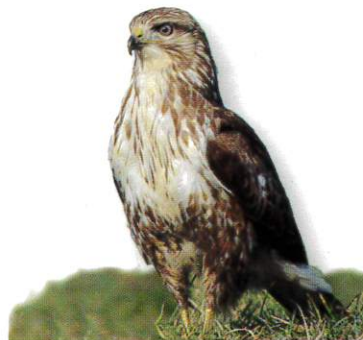
Buse variable très fréquente dans nos paysages

Ce cimetière militaire abrite 125 tombes de jeunes soldats, 107 Anglais et 18 Allemands morts pendant la bataille de Normandie. Les sépultures sont disposées autour du monument aux morts, honorant leur mémoire.